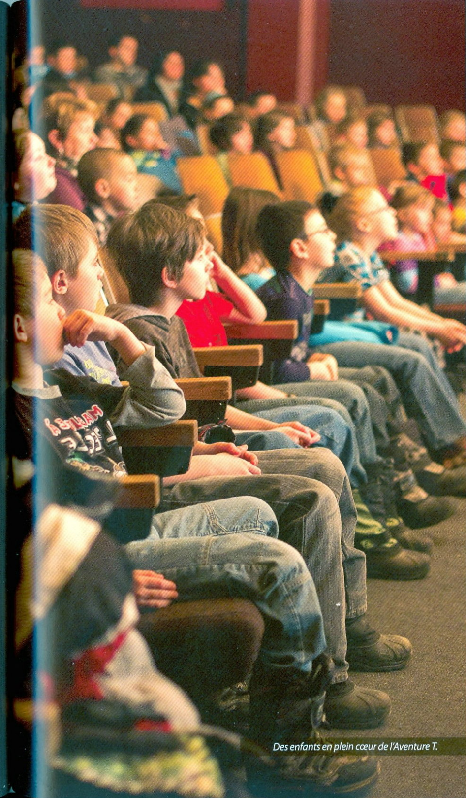
Des enfants en plein cœur de l'Aventure T.