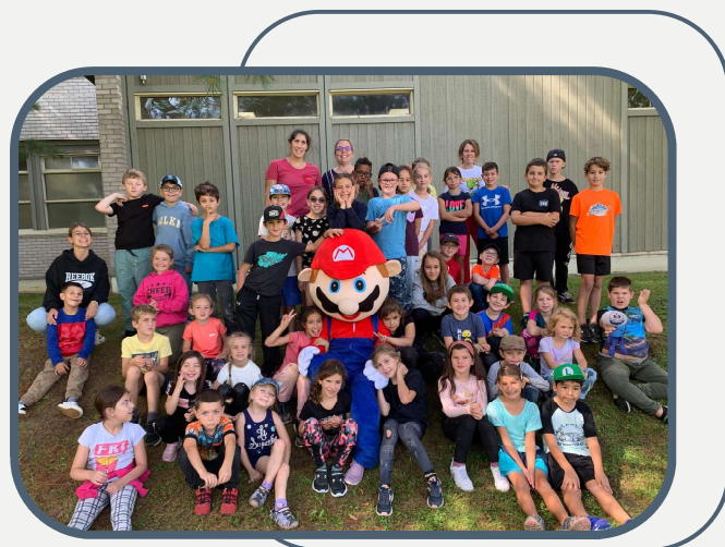
De la visite au service de garde lors d'une journée pédagogique